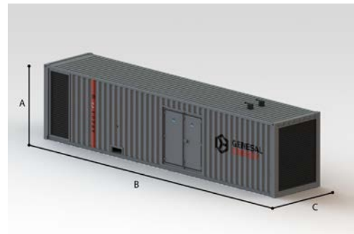
A= 2896 mm B= 12192 mm C= 2438 mm

GENESAL ENERGY products peuvent être modifiées par les développements technologiques.